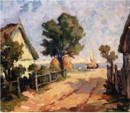
Carl Knauf, Dorfstraße in Nidden