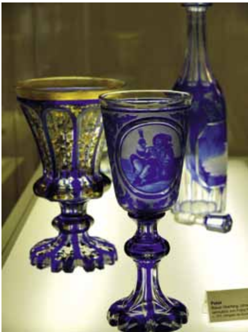
In der glücklichen Lage, sich zum Jubiläum selber zuzuprosten, sind die Glas- und Museumsfachleute in Rheinbach

Das heutige Staatliche Berufskolleg Glas, Keramik, Gestaltung des Landes Nordrhein-Westfalen Rheinbach wird im Frühling/Frühsummer 2018 einer der insgesamt drei Schauplätze für Veranstaltungen des Jubiläumsjahres sein. Zwei Projekte der Glasfachschule – eine Edition von gläsernen Hausnummern für Bürger und Institutionen sowie das erste Rheinbacher Glassymposium – sind bereits bekanntgegeben worden.